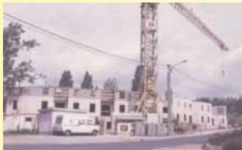
La Résidence du Moulin en construction en 1985.