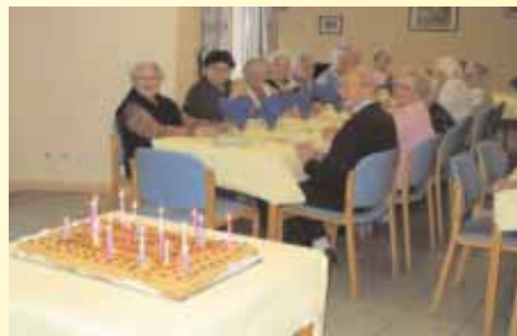
Le 28 janvier dernier, la Résidence a soufflé ses 20 bougies !

Ce foyer-logement pour personnes valides et autonomes, offre un compromis entre l'habitation individuelle et la maison de retraite médicalisée. Les résidents sont intégrés à la vie du quartier. Des prestations spécifiques leur sont offertes : une surveillance de nuit, une salle de restauration collective qui permet aux personnes de prendre leur repas en commun et de participer à des animations ponctuelles, etc. Priorité est donnée aux parents des habitants de Heillecourt. (Voir tous les détails dans la plaquette glissée dans le bulletin).