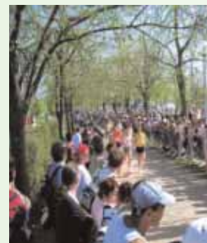
L'évènement d'avril, la Corrida et ses 5236 coureurs classés.